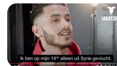
Ook de inspirerende verhalen van de modellen krijgen een podium.